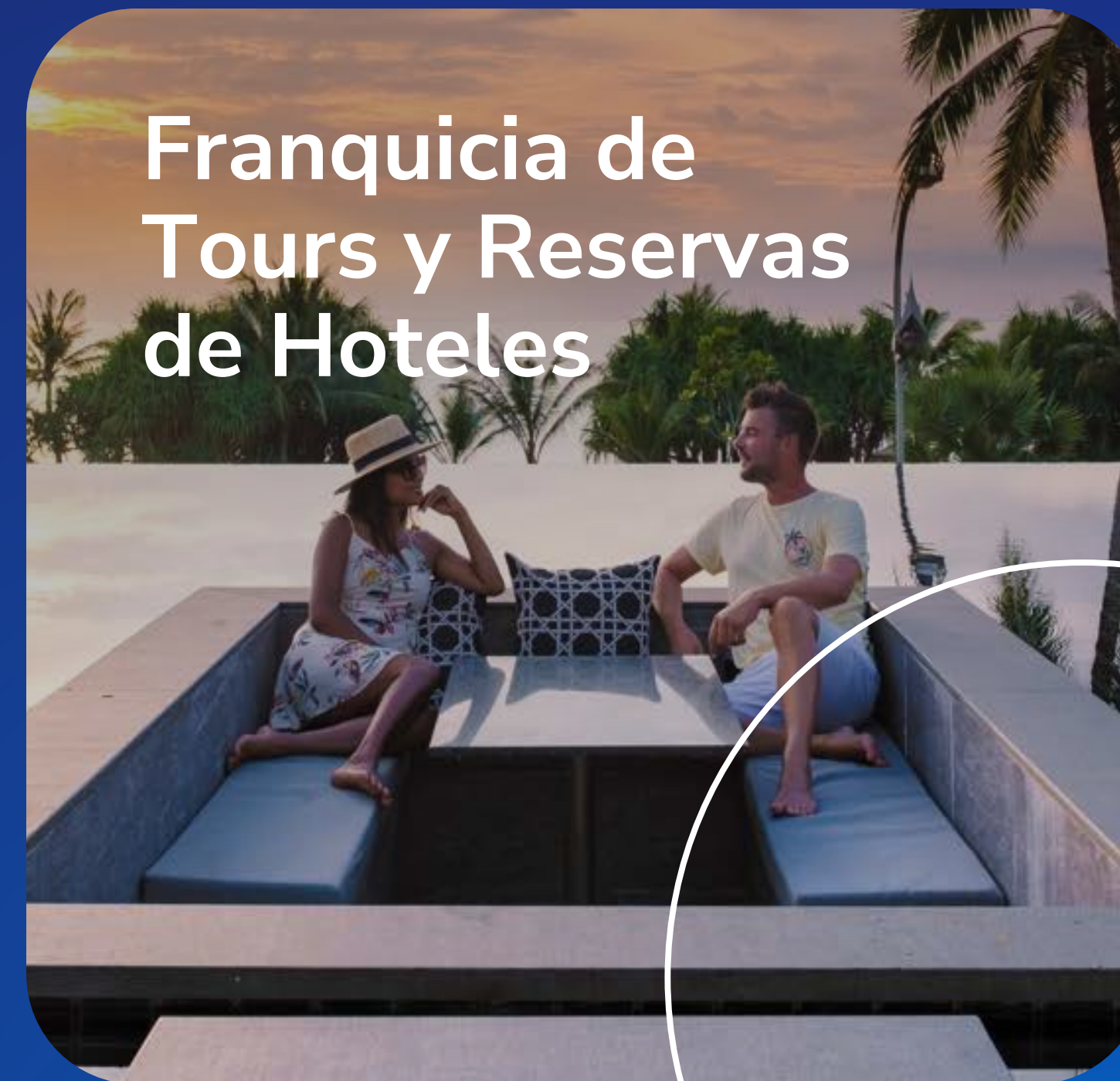
Franquicia de Tours y Reservas de Hoteles