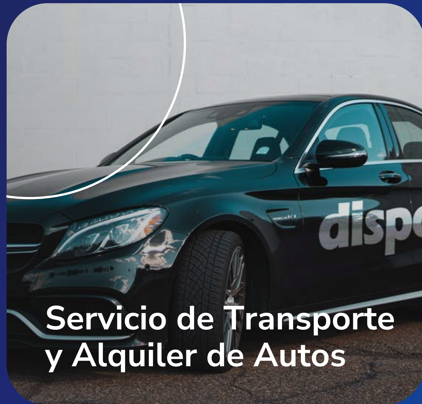
Servicio de Transporte y Alquiler de Autos