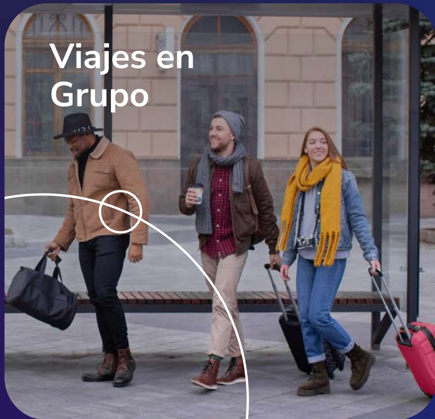
Viajes en Grupo